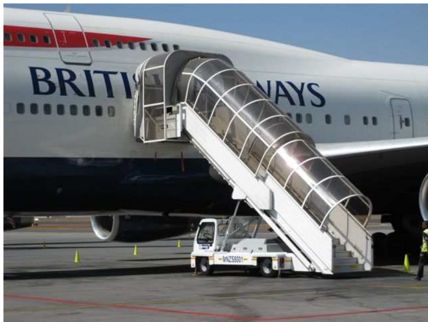
Obr. 3) Schody ABS 580 u Boeingu 787