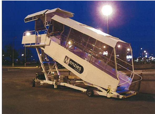
ilustrativní obrázky zastřešených schodů