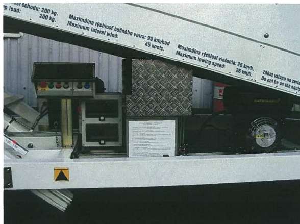
Detailní pohled na motorovou a hydraulickou část včetně ovladačů stabilizátorů, osvětlení a zdvihu.